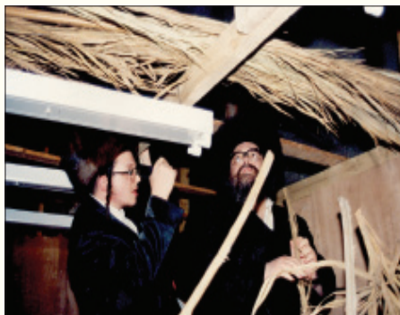
יענעם טאג און דערנאך די איבריגע אושפיזין. (יסוד ושוש העבודה - שער יא, פרק יג)

ווען א איד קומט אריין אין די סוכה דארף ער איינלאדענען די הייליגע אושפיזין בפה מלא, זיי זאלן קומען צו אים אין די סוכה אריין. ווי ס'שטייט אין זוהר הק', אז די אושפיזין קומען נישט צו גיין אויב מען רופט זיי נישט, אפילו צו א צדיק גמור, און אזוי זאל מען טוען ביי די סעודה פון בייטאג און ביי די סעודה פון ביינאכט, און פריער זאל מען איינלאדענען די אושפיזא פון