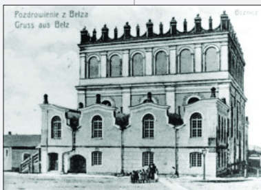
Podziwianie z Betza Gruss aus Belsa